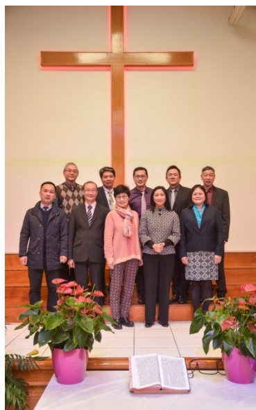
今年三月法国华福区委会在巴黎合影

最近二十年，由于中国大陆移民蜂拥进入，华人教会也不断发展壮大。从原来一个宗派发展到如今五个宗派，有超过四十家华人教会分散在西班牙二十多个城市，出席主日聚会的成人信徒约四千，儿童则约三千。