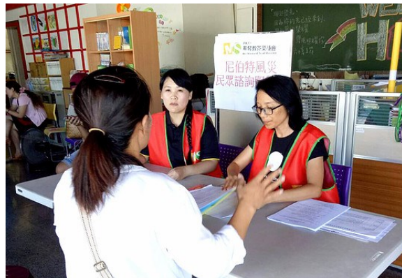
尼伯特风灾后，芥菜种会即与地方教会合作开设咨询服务站协助灾民

自一九五八年，华人基督徒在巴黎（Paris）开始祷告聚会，迄今已有五十八年历史，第