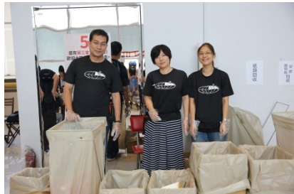
服侍大会的环保先锋