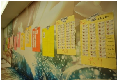
网网相连：踊跃？冷淡？