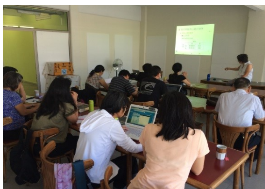
于拉丁美洲基督神学院授课情况

不论阿根廷或智利，都需更多的代祷，求神让各教会都能有好的属灵根基，并燃起复兴的灵火，让众多华侨得享救恩的好处。