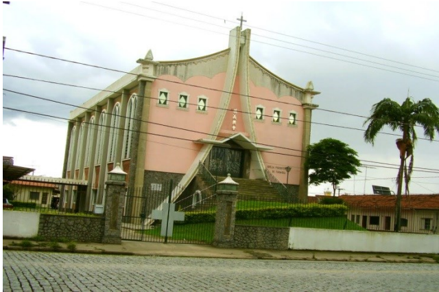
在巴西聖保羅（San Paulo）地區的慕義長老教會

南美洲華人教會最需要的是禱告，求聖靈興起有心事奉的人材，肯順服神的差遣。另一個需要就是會講粵語的教會領袖，因為現今有許多從廣東來的同胞，若有講粵語的教會，就能更容易吸引他們。