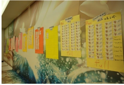
網網相連：踴躍？冷淡？