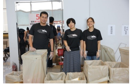
服侍大會的環保先鋒