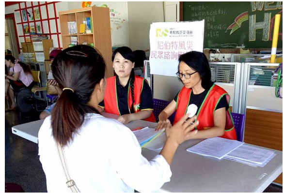
尼伯特風災後，芥菜種會即與地方教會合作開設諮詢服務站協助災民

《馬太福音》二十五章四十節說：「……我實在告訴你們，這些事你們既做在我這弟兄中一個最小的身上，就是做在我身上了。」教會若想要回應社區的需要，推展社區的事工，若能跟福音機構彼此配搭事奉，或許可以讓資源發揮加乘的果效，並提升服務的專業能力，使其滿足受助者生命與靈命的需求，讓神國的理想早日實現。