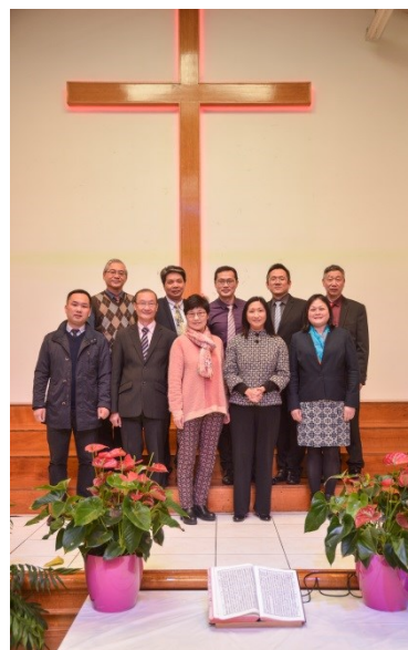
今年三月法國華福區委會在巴黎合影