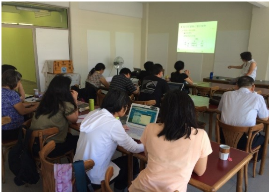
於拉丁美洲基督神學院授課情況

不論阿根廷或智利，都需更多的代禱，求神讓各教會都能有好的屬靈根基，並燃起復興的靈火，讓眾多華僑得享救恩的好處。