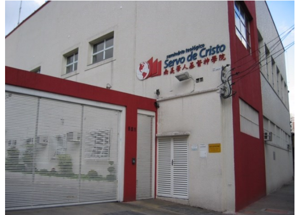
巴西的南美華人基督神學院