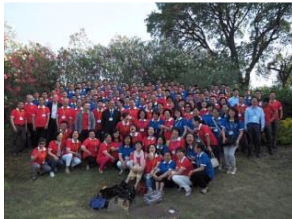
意大利基督教華人教會 同工團隊