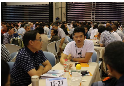
分組討論，欲罷不能