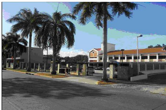
巴拿馬基督教華人教會

也在巴拿馬出版報紙及設有電臺。二千／二千運動也藉當地的華人教會建立了仁愛書院，現在已經有近千位學生。巴拿馬華人教會的同工很努力地保持合一的精神，每年受難節，巴拿馬華人福音事工都會有三個聯合聚會：