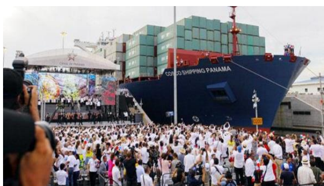
今年六月二十六日擴建運河後竣工啟用儀式