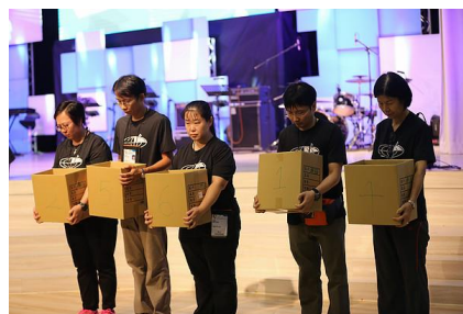
每一份獻上，神都已悅納