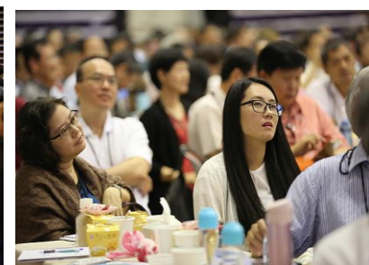
專心聆聽，領受神恩