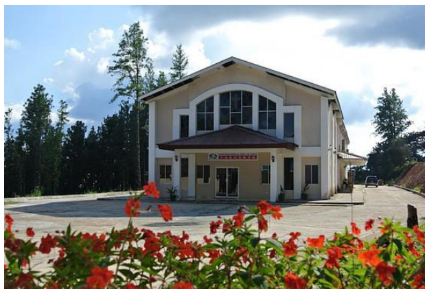
中南美洲聖經學院

給教牧同工的退修會、給教會信徒領袖的講座及所有華人教會的聯合退修會。今年的聯合退修會大小共九百五十人參加。明年除了聯合退修會之外，還會在六月聯合以音樂巡迴佈道，在不同城市合辦音樂佈道會。