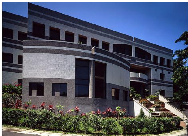
第一家政府立案授予學位的神學院： 浸信會神學院