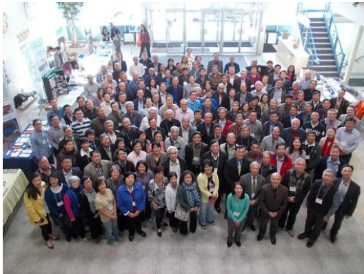
二〇一五年 美、加華人教會策進會議