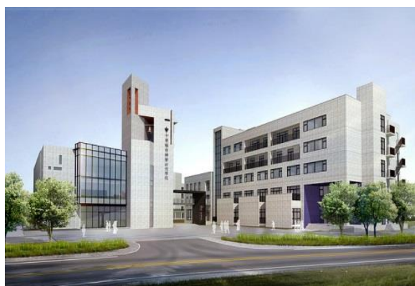
中華福音神學院籌建中的新校區

另外與新店行道會合作設新店校區，進行之「教牧碩士科」——「都市教會的開拓與牧養」，神學院負責《聖經》與神學核心課程，實踐課程則由新店行道會規劃。「教牧碩士科」也會在其他校區按其不同特色規劃實踐課程，未來焦點往社區學院模式發展「學分班」在地化，以及成全各具特色的「分校」。