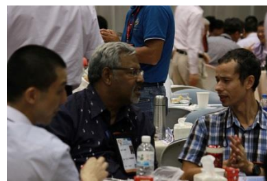
他们以华语讨论吗？