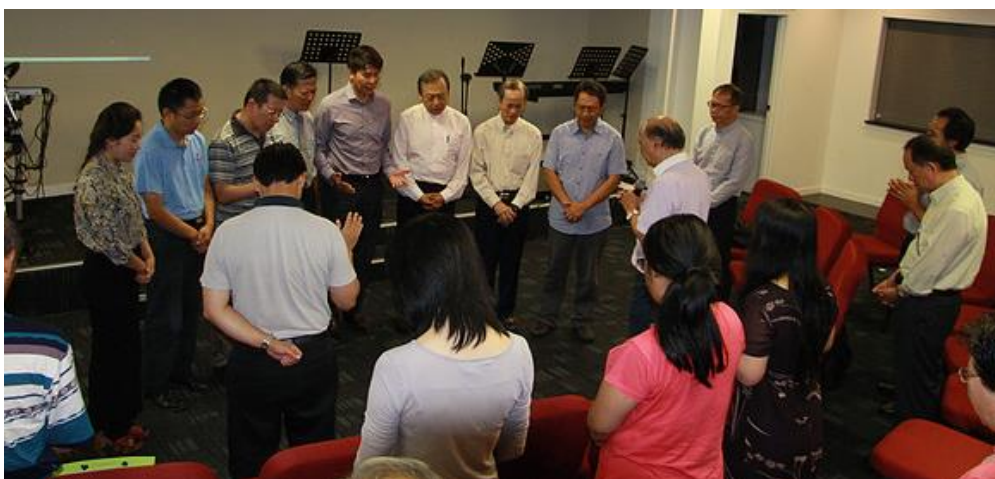
二〇一六年三月一日牧同工联祷会暨华福新西兰区委会主席交接