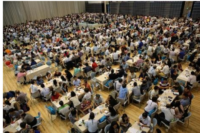
分组场地虽小，讨论的内容却大