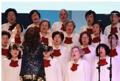
看！多么充满活力的颂唱者