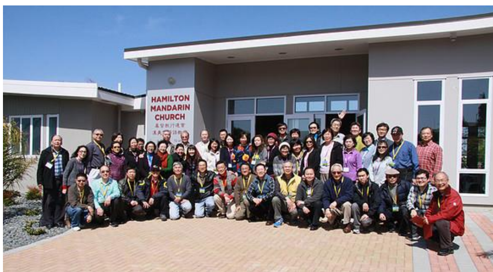
二〇一四年汉美敦（Hamilton）牧者退修会

三．除了复兴华人教会，同心迈向宣教外，也积极连结本地不同族群的教会，让教会对社会有影响力，为新西兰这国家带来真正的祝福。