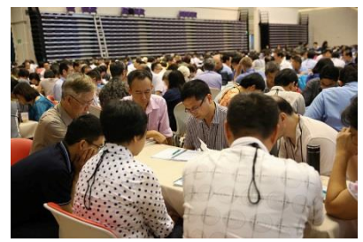
主啊！让我们因你而更新改变。