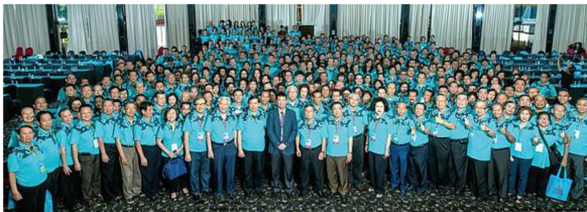
第二届印度尼西亚华人福音会议

近十年来，随着印度尼西亚经济蓬勃的发展，中国、台湾及东南亚来印度尼西亚的华人，无论是经商或工作大约有近六十万。如何开展对他们的福音工作，亦是华人教会领袖屡屡思考的问题。尽管近年来，华文教育在印度尼西亚各地普遍兴起，但不能一蹴而成。求神兴起更多有负担的牧者及同工在「华人教会，天下一心；广传福音，直到主临」的旗帜下，同心合一将福音广传至印度尼西亚更多城、乡，以完成神托付给我们的使命！