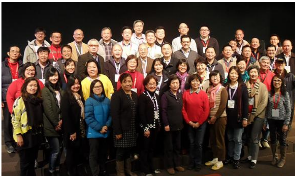
二〇一五年基督城牧者退修