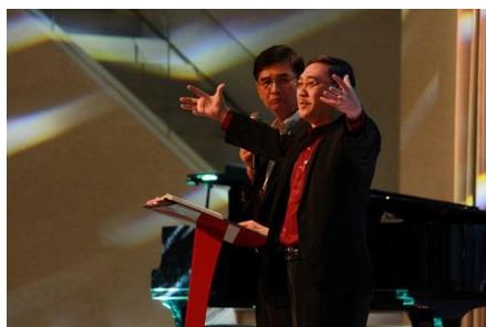
查经讲员分享信息