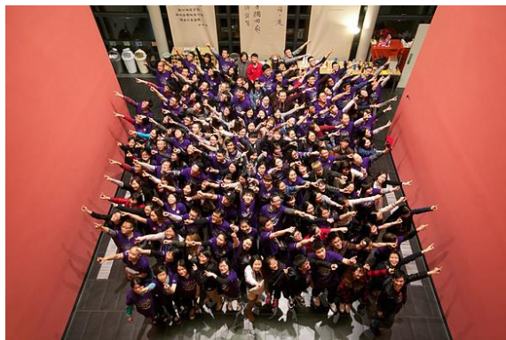
复活节学生门训营