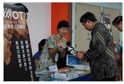
细心介绍、耐心聆听