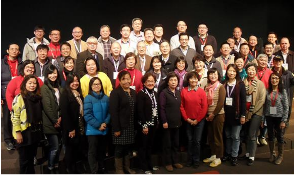
二〇一五年基督城牧者退修