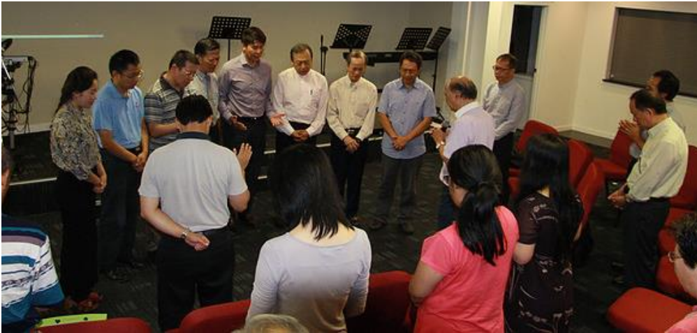
二〇一六年三月一日牧同工聯禱會暨華福新西蘭區委會主席交接