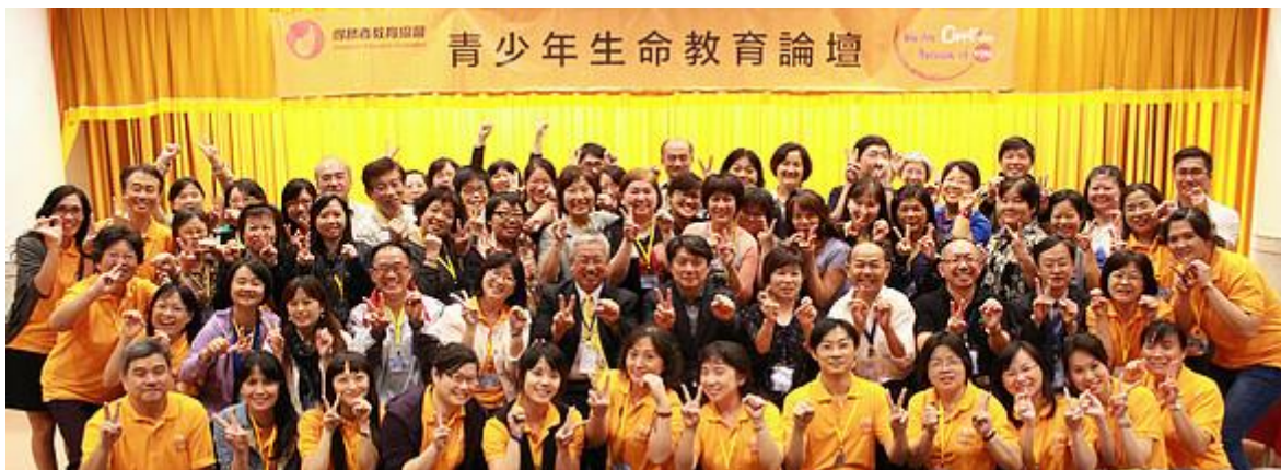
得勝者教育協會舉辦的青少年生命教育論壇