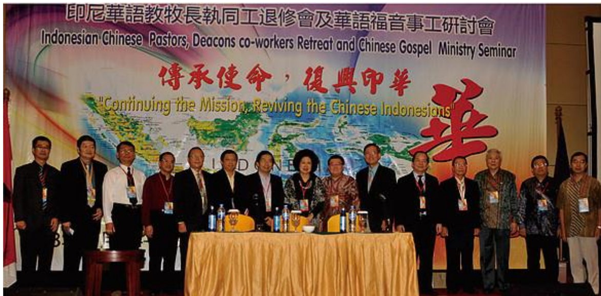
印尼華語教牧長執同工退修會及華語福音事工研討會