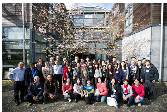
恩泉退休會全英牧者

面對工場的需要，教會和機構的數量都在不斷增加，請大家為眾教會、機構的合一見證、資源共享禱告；同時，面對新的福音群體，也求神興起更多工人，在神學和語言上都有相應的裝備；最後，請為目前在工場服侍的工人禱告，求神在忙碌挑戰的事奉中賜他們身心靈都健康。