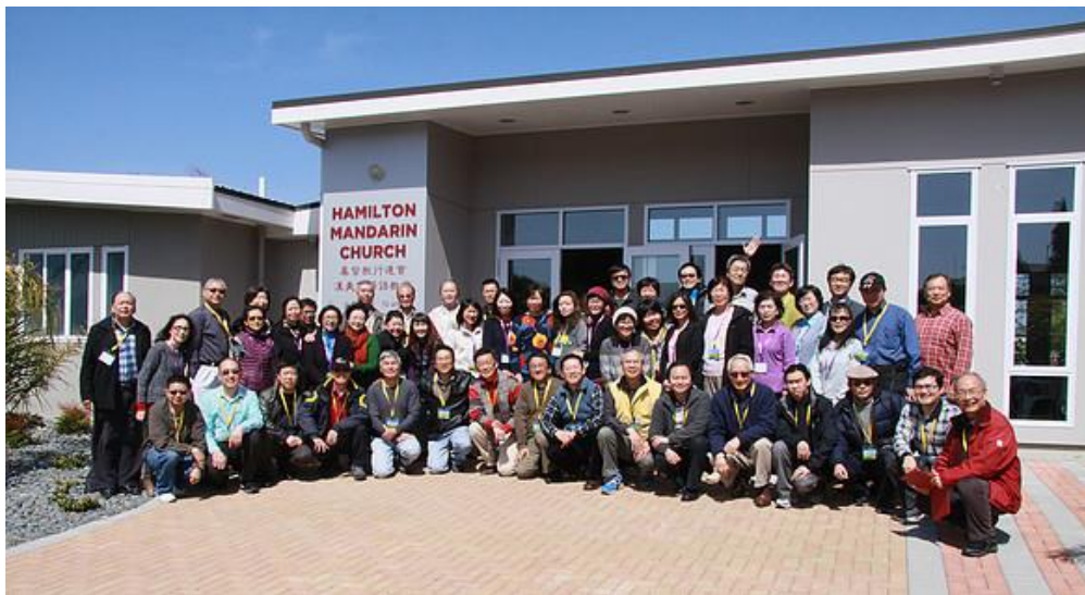
二〇一四年漢美敦（Hamilton）牧者退修會

三· 除了復興華人教會，同心邁向宣教外，也積極連結本地不同族群的教會，讓教會對社會有影響力，為新西蘭這國家帶來真正的祝福。