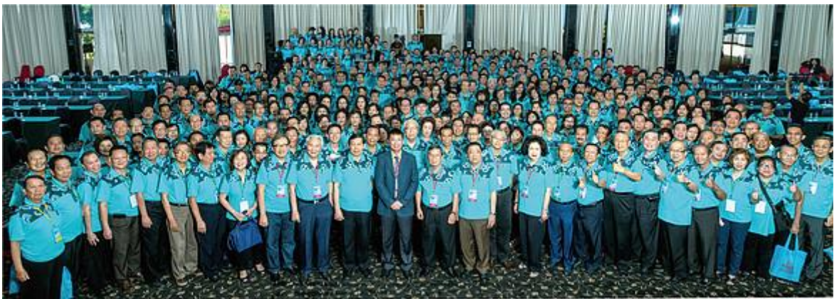
第二屆印尼華人福音會議

近十年來，隨著印尼經濟蓬勃的發展，中國、臺灣及東南亞來印尼的華人，無論是經商或工作大約有近六十萬。如何開展對他們的福音工作，亦是華人教會領袖屢屢思考的問題。儘管近年來，華文教育在印尼各地普遍興起，但不能一蹴而成。求神興起更多有負擔的牧者及同工在「華人教會，天下一心；廣傳福音，直到主臨」的旗幟下，同心合一將福音廣傳至印尼更多城、鄉，以完成神託付給我們的使命！