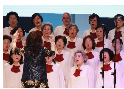
看！多麼充滿活力的頌唱者