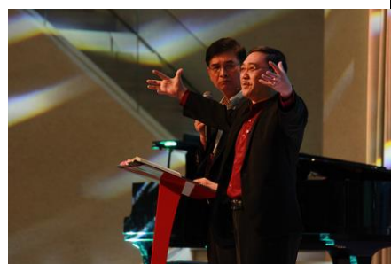
查經講員分享信息