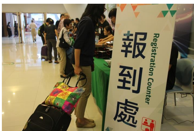
「最重要」的出席人必到处