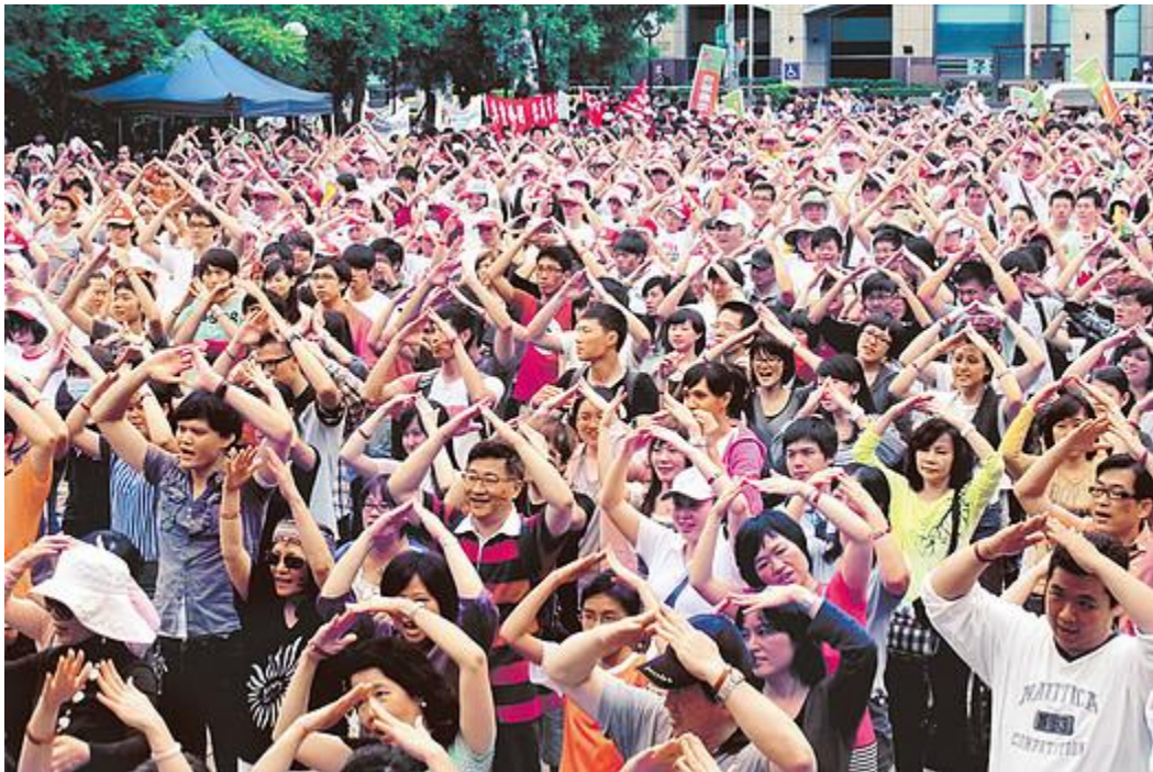
为家庭议题二十万基督徒走上街头