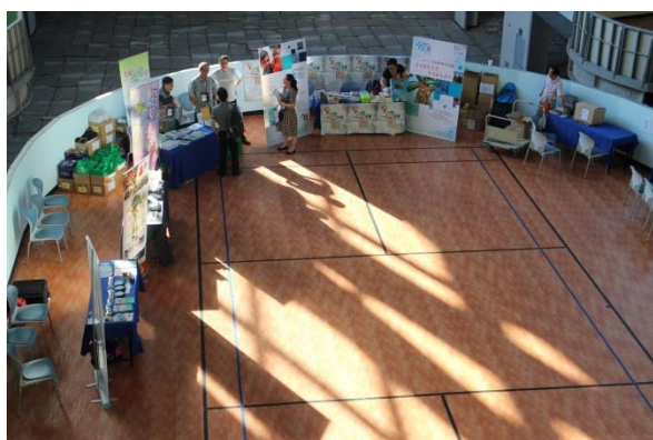
大会设有许多展览摊位