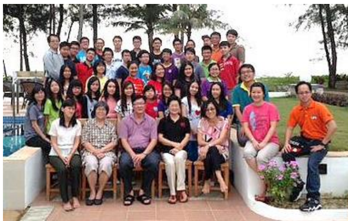
二〇一三年联合夏令营

教中国大会，今年九月二十七至三十日将于济州岛主办「2030 宣教中国」大会，韩国区委会与中国宣教协议会将全力协助该大会各方面的事工，预计有一千二百人参加，并期待更多教会领袖对宣教事工作出行动，成为关心差传的教会，在未来差派更多宣教士，向全球未得之民传扬福音。