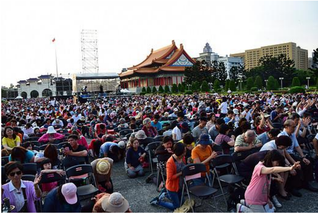
全球祷告日齐跪凯达葛兰大道为台湾悔改