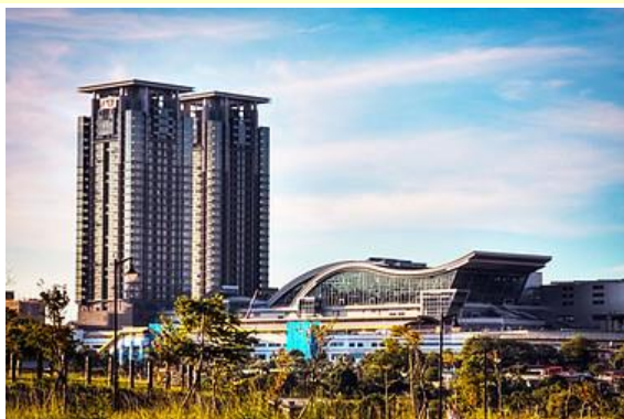
大会会场：美河堂外貌