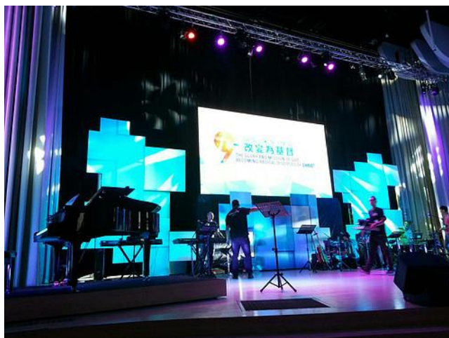
大会舞台充满时代气息