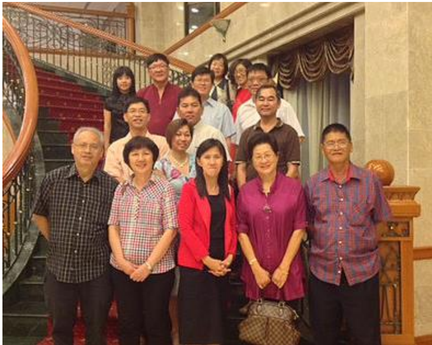
文莱华福区委会新年感恩晚宴