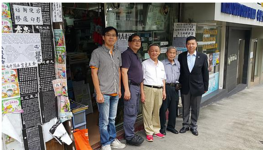
澳门华福区委会部份同工合影