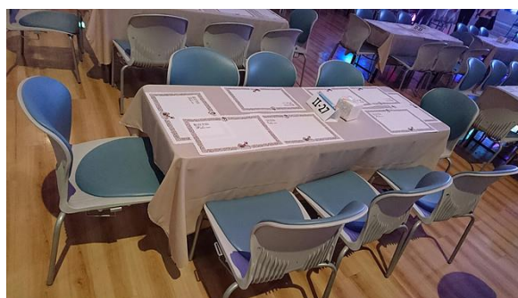
出席者环绕小桌各抒己见