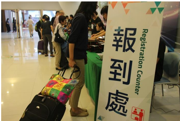
「最重要」的出席人必到處