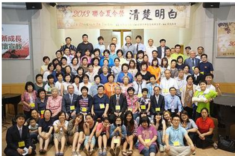
汶萊教會聯合少年聚會