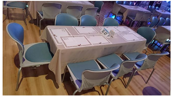
出席者環繞小桌各抒己見