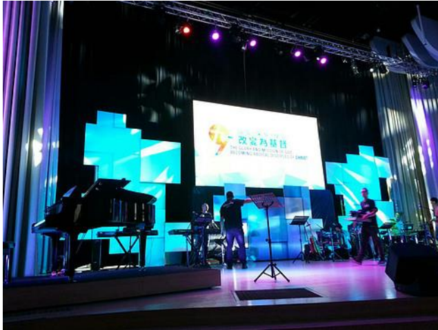
大會舞臺充滿時代氣息