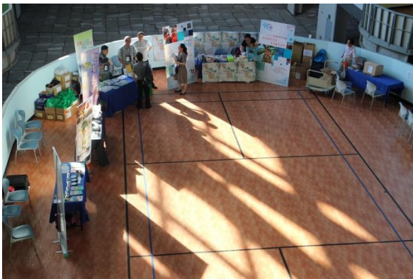
大會設有許多展覽攤位