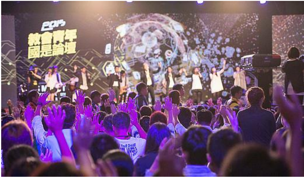
活力綻放的臺灣教會